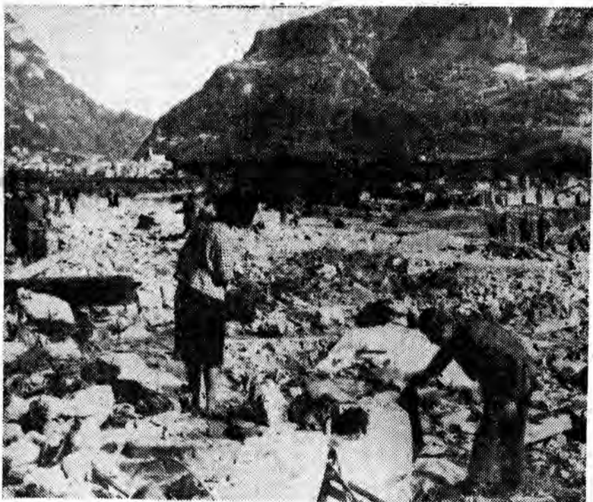
W dolinie Longarone trwają intensywne poszukiwania i grabieże ofiar strasznej katastrofy.

Na zdjęciu: cudem uratowanych z katastrofy dwoje mieszkańców Longarone na gruzach własnego domu.