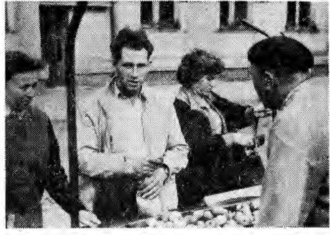
RZESZÓW. Przy straganie z owocami.

Ogólnopolski program TV Warszawa (kl. V-VII) 11.25 Frerzwa 11.55 Dla szkół: Historia (kl. V) 12.25 Przerwa 16.25 Program dnia 16.30 Magazyn dla ko-biet 17.00 Wiadomości dzien-nika 17.05 Dla dzieci star-szych „Chcę zostać straża-kiem” 17.55 „Kilka słów o progr. TV” 18.10 PKF 18.20 „Spotkania z przyrodą” progr. film. 18.50 „Wszystkie dni każdego roku” — public młodzi. 19.20 „Paryskie Va-riete” — film 19.50 Dobranoc 20.00 Dziennik 20.25 „Ekono-miści” 21.05 Recital chopi-nowski 21.40 Kobra. KATOWICE: 16.50 „TV Ka-towice informuje”.