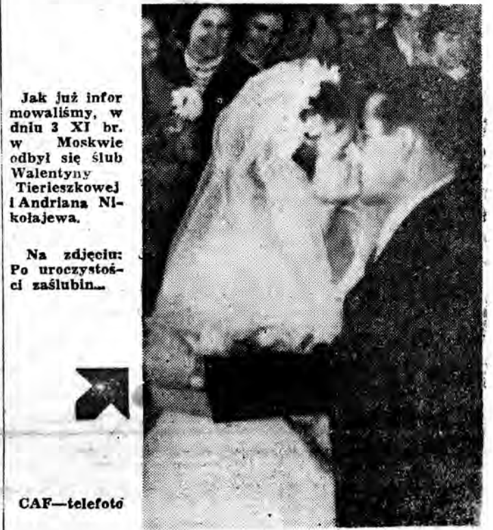
Jak już informowaliśmy, w dniu 3 XI br. w Moskwie odbył się ślub Walentyny Tierieszkowej i Andriana Nikolajewa.