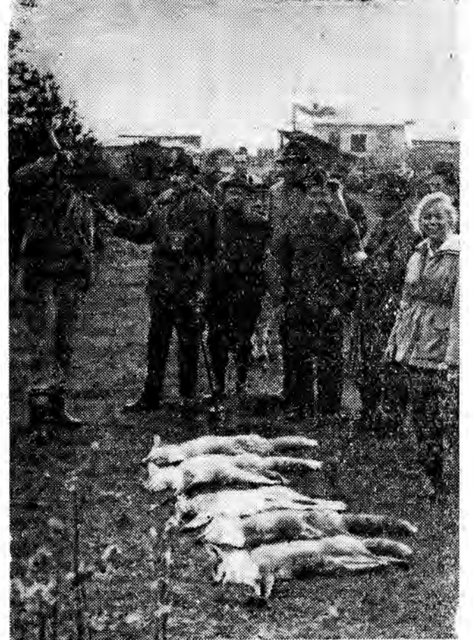
Sezon polowań na lisy — w pełni. Na zdjęciu: łowcy ob-wieszczą zakończenie polowa-nia.