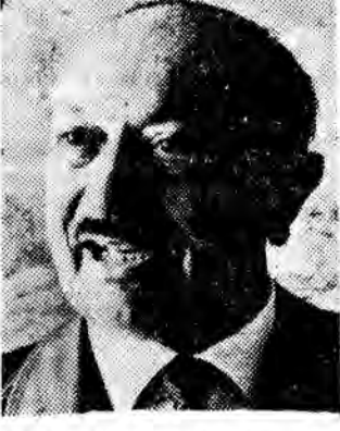
Dr. Simon Wiesenthal — kierownik Żydowskiego Ośrodka Dokumentacji w Wiedniu, który swoją działalność powojenną poświęcił na zbieranie materiałów obciążających hitlerowskich zbrodniarzy wojennych, trafił na ślad hitlerowca odpowiedzialnego za aresztowanie i śmierć Anny Frank, której pamiętniki wstrząsnęły sumieniem świata. Jest nim Karl Silberbauer.

W godzinach wieczornych Mikojan spotkał się z premierem W. Bryantem, Home. Podczas rozmowy, która trwała ponad półtorej godziny, poruszono sprawy interesujące obie strony.