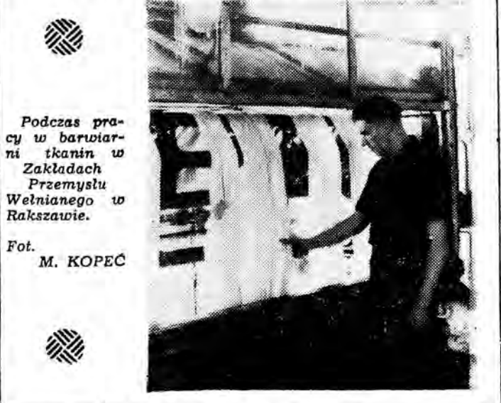
Podczas pracy w barwniarni tkanin w Zakładach Przemysłu Włókiennego w Rzeszowie.