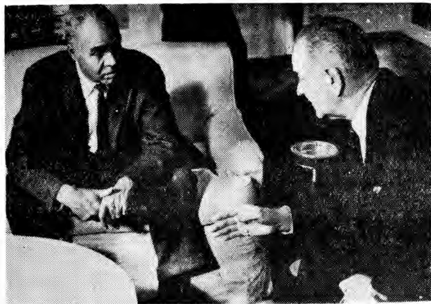
Prezydent USA L. B. Johnson przyjął ostatnio w Białym Domu sekretarza generalnego Stowarzyszenia na rzecz postępu ludności kolorowej Roy Wilkinsa (z lewej).

W godzinach wieczornych w Tarnobrzegu i Piasecznie odbyły się zabawy górnicze.