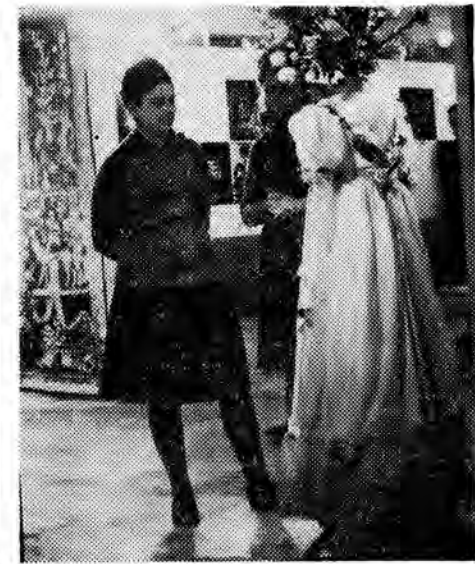
Wystawa polskiej plastyki telewizyjnej otwarta w dniu 19 XI w gmachu Filharmonii Narodowej w Warszawie jest ciekawym przeglądem tych form plastycznych, które wynikają z techniki obrazu telewizyjnego.