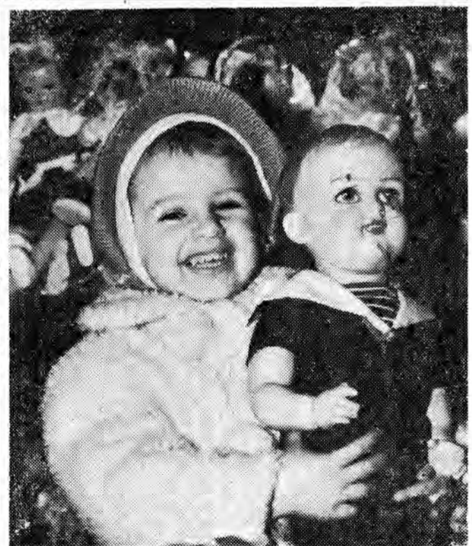
Nareszcie własna lalka...

Drugą nowością będą papierosy „Wisła”, produkowane z najlepszych tytoni krajowych typu „Virginia” oraz innych. „Wisła” będzie papierosem pośredniej klasy między „Giewontami” i „Sportami”. Wytwórnia papierosów w Radomiu rozpocznie dostawę „Wisły” na początku nadchodzącego roku. Będą one sprzedawane w paczkach po 20 szt. w cenie 4 zł.