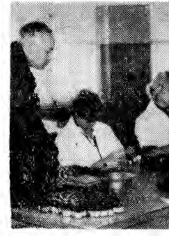
Wytwórnia Cementów Dentystycznych w Rzeszowie.