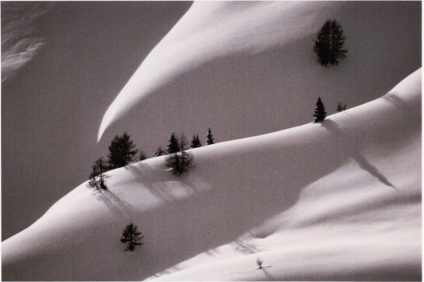
Pandemic in the Dolomites 1