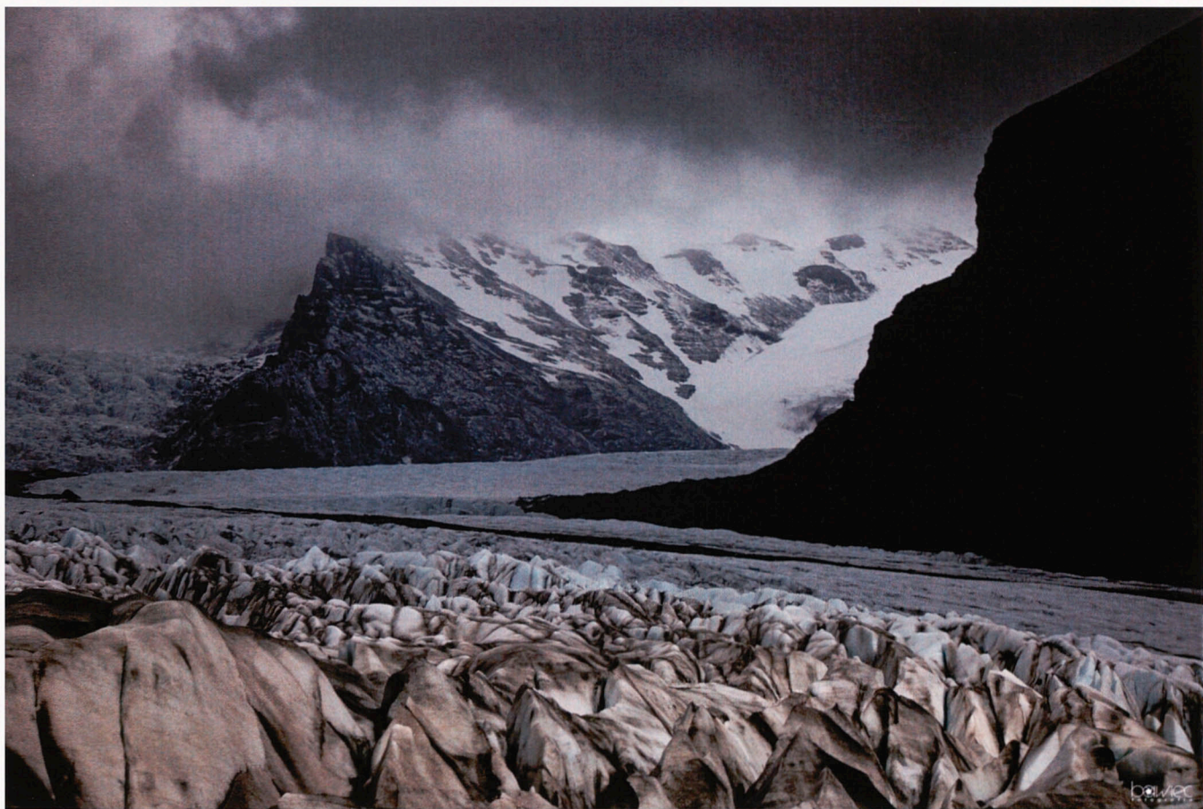
Na lodowcu - Islandia