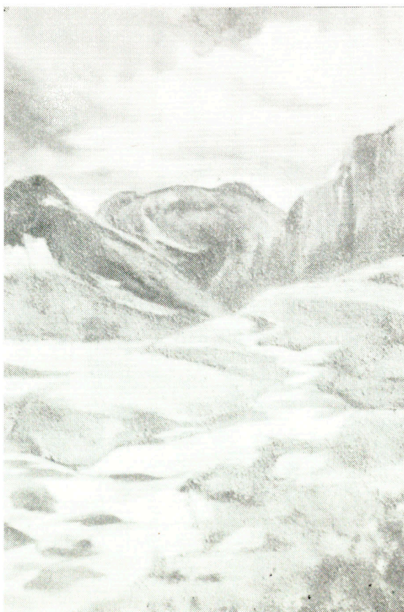
Sławomir Gurdak, Potok, olej

WYDAWCA KATALOGU: Wojewódzki Dom Kultury w Rzeszowie