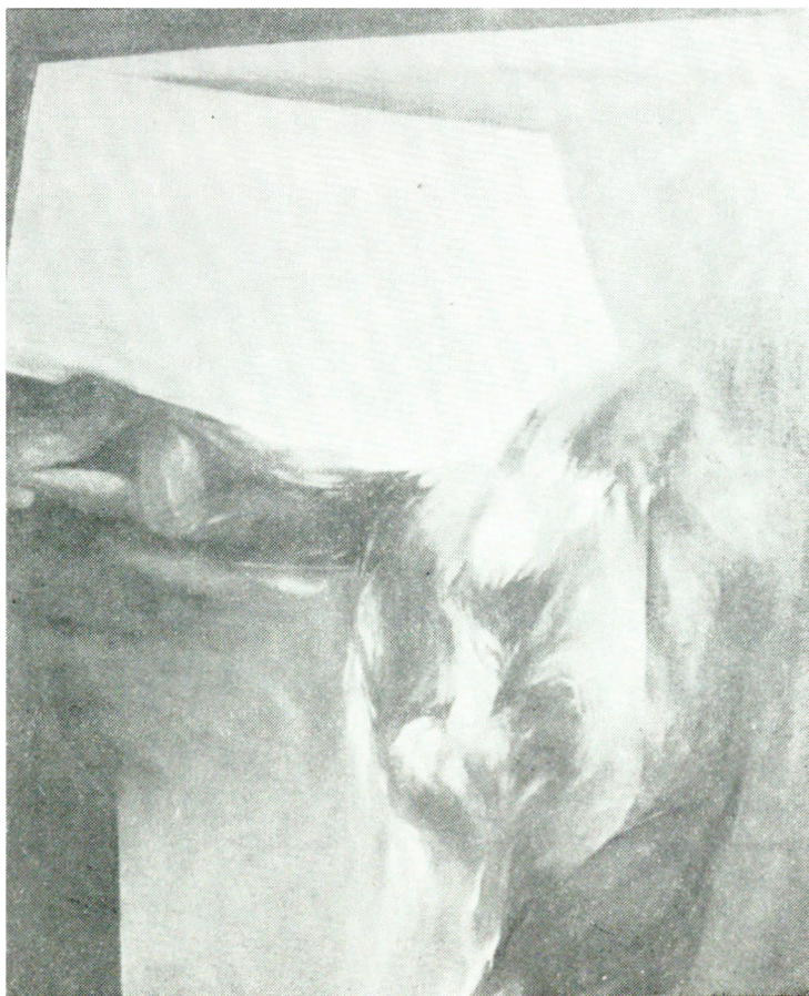
Anna Charciarek, Obraz V, olej