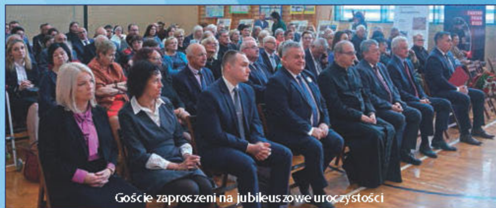
Goście zaproszeni na jubileuszowe uroczystości