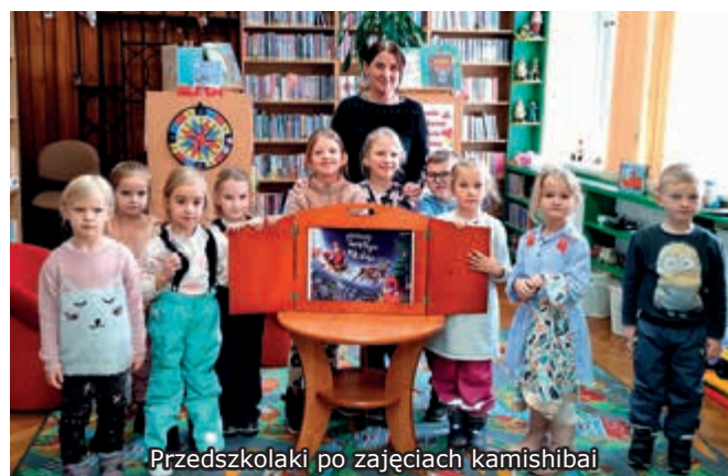
Przedszkolaki po zajęciach kamishibai

Mikołajki to święto, które uwielbiają wszystkie dzieci. Mikołaj kojarzy nam się przede wszystkim ze starszym panem z brodą i czerwonym kubrakiem, który przemierza świat w saniach ciągniętych przez renifery. Rozwozi on grzecznym dzieciom prezenty. Aby dobrze przygotować się na spotkanie ze św. Mikołajem, dzieci z przedszkola Wesołe Misie u Speakera odwiedziły bibliotekę i wysłuchały bajki pt. Prezenty Świętego Mikołaja , z której dowiedziały się, co należy zrobić, aby dostać upominki.