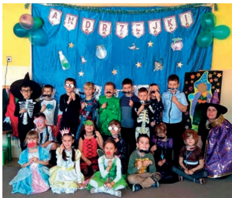
...i w zerówce