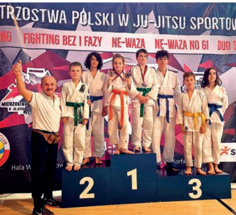
Uczestnicy Mistrzostw Polski w Katowicach