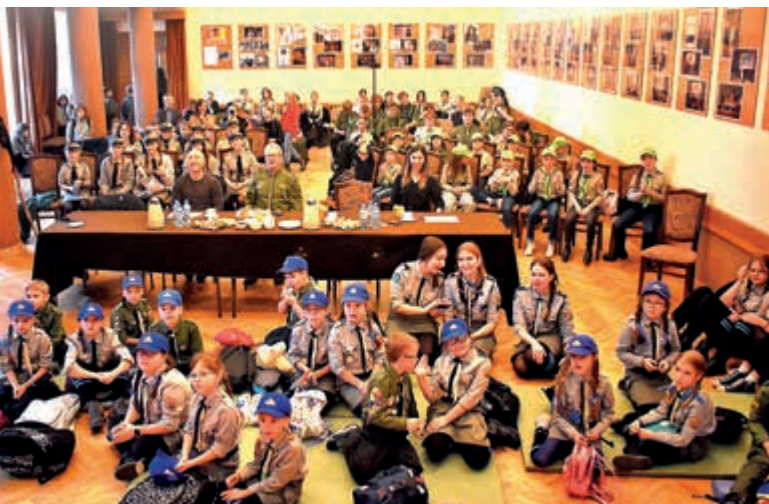
Uczestnicy festiwalu wraz z jury

Harcerstwo to wspaniała droga dla młodego człowieka, aby odnaleźć się w świecie. Jego podstawą jest wspólnota, w której można zawiązać przyjaźnię, nawet na całe życie. To nie tylko zabawa, ale również dyscyplina i poczucie obowiązku. To zdobywanie nowych umiejętności i nauka zaradności życiowej. Pomaganie ludziom uwrażliwia młodych na potrzeby innych i uświadamia o konieczności niesienia pomocy.