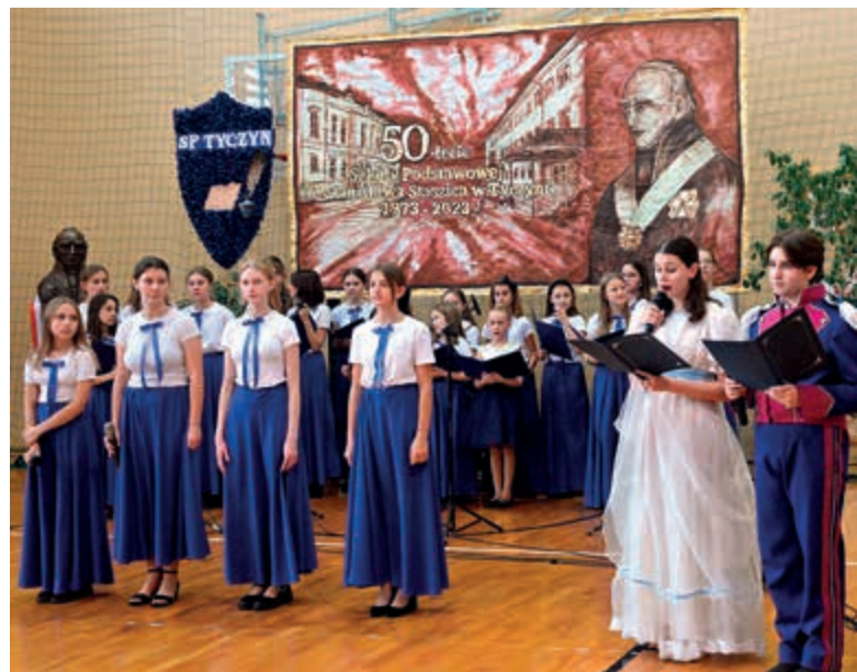
Program artystyczny w wykonaniu absolwentów i uczniów SP w Tyczynie