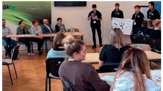
Uczniowie ZS w Tyczynie uczestniczyli w warsztatach pt. Zostań swoim szefem