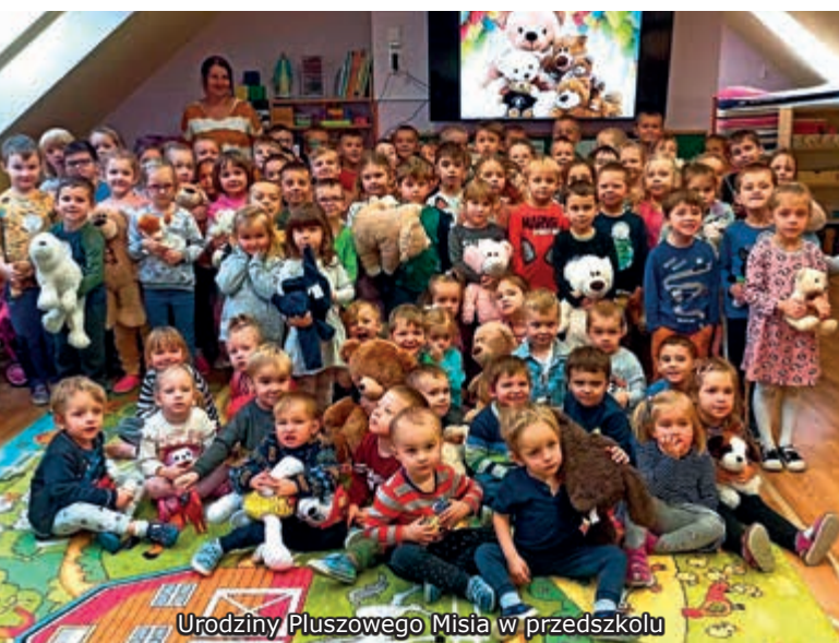
Urodziny Pluszowego Misia w przedszkolu

25 listopada swoje święto obchodzi Pluszowy Miś. Maskotka misia powstała ponad sto lat temu i do dziś jej popularność nie maleje. Każdy z nas miał przecież w dzieciństwie ulubionego pluszaka, do którego można było się przytulić, wyszeptać mu największe tajemnice lub potargać za uszko. Do dziś najbardziej popularną zabawką wśród dzieci przedszkolnych jest właśnie pluszowy miś. O tym, jak bardzo znana jest ta zabawka, można było się przekonać podczas zajęć edukacyjno-czytelniczych w przedszkolu.