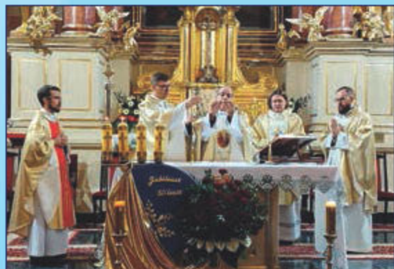
Uroczystości rozpoczęły się mszą świętą w kościele parafialnym w Tyczynie