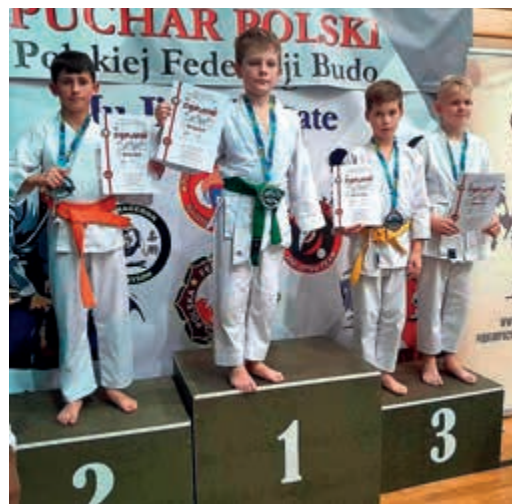
Medaliści Pucharu Polski