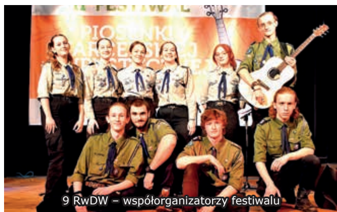
9 RwdW – współorganizatorzy festiwalu

W tym roku udział w festiwalu wzięły następujące drużyny: 16 Gromada Zuchowa Tropiciele tajemnic – laureaci Grand Prix, Szczep żuawi – zespół Muły bagienne , 100 gromada zuchowa Leśne bractwo , Szczep 16 Semper Fidelis , Grupa Ożóg band , 9 Rzeszowska Drużyna Wędrownicza, Dwie z gatunku z 16 GZ, Tosia Makusz z 16 GZ Ekipa kot , Gosia Mikulec z 16 GZ. Każda drużyna została nagrodzona pamiątkowym dyplomem oraz artystycznym i niepowtarzalnym totemem wykonanym własnoręcznie przez członków 9 RwdW.