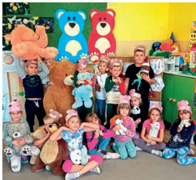
Dzień Pluszowego Misia w zerówce