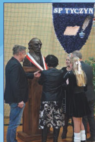
Odsłonięcie popiersia patrona szkoły Stanisława Staszica