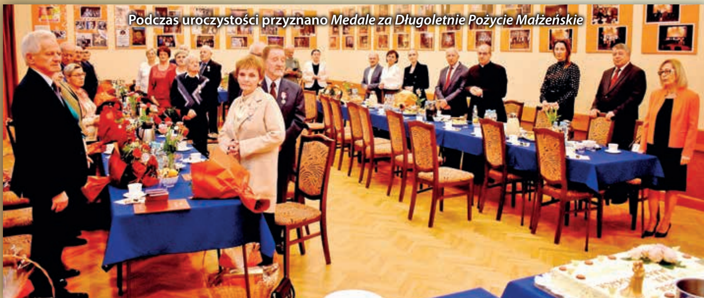
Podczas uroczystości przyznano Medale za Długoletnie Pożycie Małżeńskie