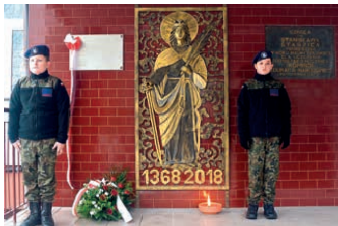
Z okazji 50-lecia SP w Tyczynie została ufundowana tablica pamiątkowa