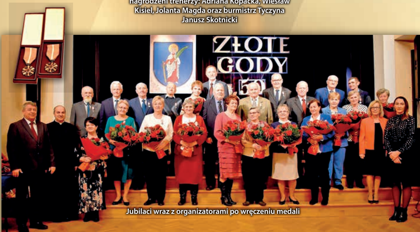
Jubilanci wraz z organizatorami po wręczeniu medali