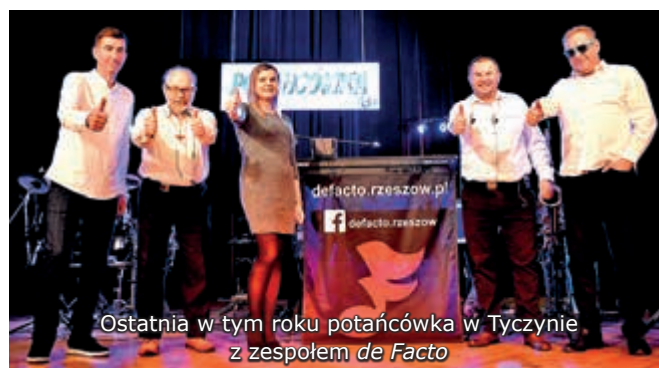
Ostatnia w tym roku potańcówka w Tyczynie z zespołem de Facto