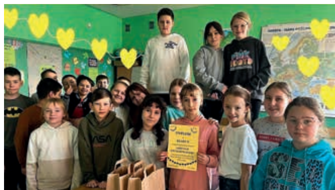
Zwycięzcy konkursu na najdłuższy łańcuch życzliwości

aż 300 serc! Duże brawa należą się dla uczniów kl. V, którzy zdobyli Nagrodę Główną w tym konkursie. Dla podkreślenia ważności tego dnia uczniowie założyli żółte elementy garderoby. To był bardzo pozytywny i życzliwy dzień. Dziękujemy wszystkim uczniom i nauczycielom za zaangażowanie. Warto być życzliwym!