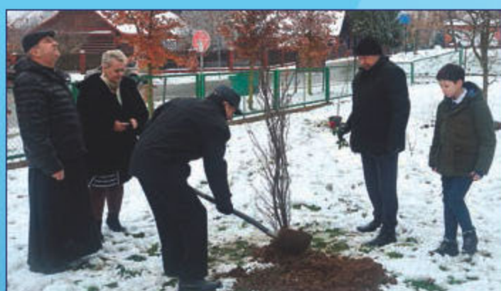
Sadzenie Dębu Pamięci