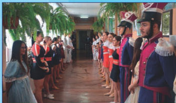
Wchodzących do szkoły gości witał szpaler uczniów i absolwentów