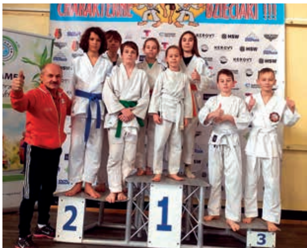
Charakterne dzieciaki z Tyczyna