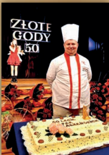
Na jubilatów i gości czekał tort