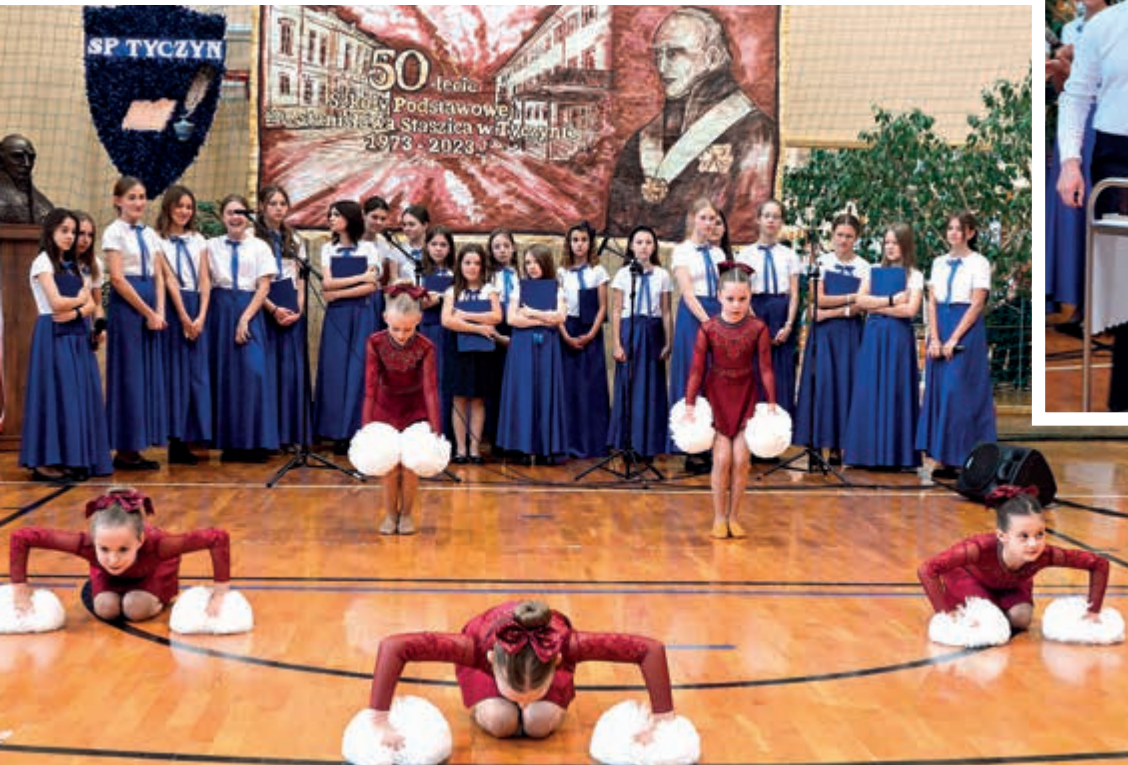
Podczas gali wystąpiły najmłodsze przedstawicielki zespołu Flimero – uczennice SP w Tyczynie

Na koniec uroczystości na sali pojawił się jubileuszowy tort, a goście zostali zaproszeni do wspólnego stołu, gdzie długo jeszcze trwały rozmowy i wspomnienia.