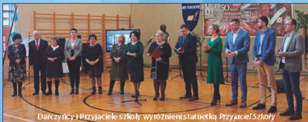
Darczyńcy i Przyjaciele szkoły wyróżnieni statuetką Przyjaciel Szkoły