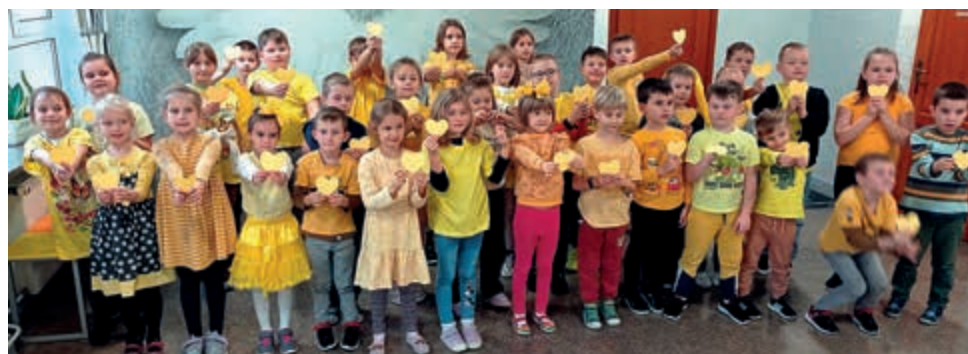
Najmłodsi uczniowie szkoły z sercami życzliwości

Na korytarzu szkolnym można było zobaczyć rozwieszone girlandy z serc Łańcuchy życzliwości , które zostały przygotowane przez każdą z klas. Najdłuższy z nich liczył