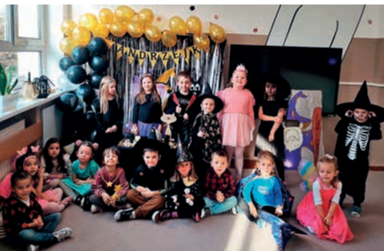
Andrzejki w przedszkolu...

Nie zabrakło też lania wosku przez dziurkę od klucza i prób odczytania powstałych kształtów. Wszyscy bawili się wspaniale. Piękne dekoracje sal i ciekawe rekwizyty dostarczyły dzieciom wielu emocji i przeżyć oraz służyły poznawaniu naszej ludowej tradycji.