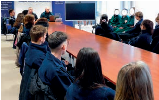
Uczniowie klasy penitencjarnej na zajęciach w Zakładzie Karnym w Rzeszowie