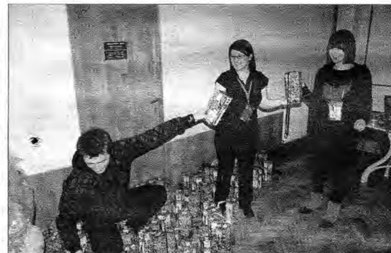
W sztabie WOŚP w Lubaczowie do późnych godzin segregowano puszkę, a potem liczone pieniądze.