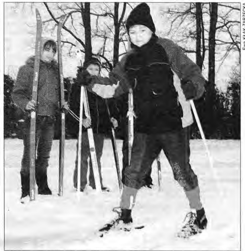
Sprzęt już jest. Teraz uczniowie chcą, by śnieg leżał przynajmniej do wiosny.

Uczniowie czekają teraz na uruchomienie trasy biegowej, którą planują w Radawie utworzyć władze gminy. – Chcemy ożywić to miejsce zimą. Dotychczas ludzie organizowali tu kuligi i ogni-