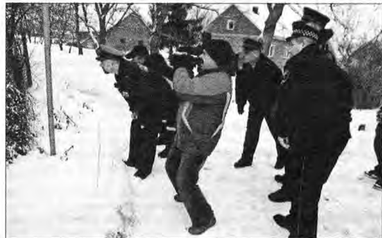
Pojawienie się niespodziewanego gościa postawiło na nogi policję, straż miejską oraz dziennikarzy.

Cały czas zwołany na przęde sztab, złożony z policji, straży miejskiej i powiatowego lekarza weterynarii debatuje nad sposobem czasowego unieszkodliwienia zwierzęcia i przetransportowania go w bezpieczne miejsce. Na miejscu pojawia się myśliwy ze sprzętem. Czekamy tylko na środek usypiający. Organizatorzy akcji pojechali po ten środek do kliniki doktora Fedaczyńskiego. Kiedy wreszcie są z powrotem, zaczyna powoli zapadać zmrok. – Jeśli uda się mu podać środek usypiający, zbadamy stan jego zdrowia. Pewnie zasięgamy opinii ekspertów z