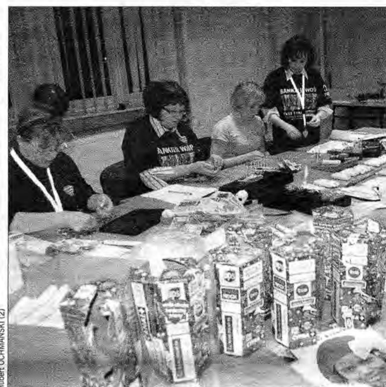
Bankierem WOŚP od wielu lat są panie z jarosławskiego oddziału Banku PKO SA.

podpisem premiera Donalda Tuska. W powiecie jarosławskim w finału Orkiestry włączyło się prawie tysiąc osób. Na ulicach miasta, a także w: Dobkowicach, Muninie, Pawłosiowie, Pełkiniach, Pruchniku, Radymnie, Szówsku, Tucempach, Wiazownicy, Kidalowicach, Ożansku, Wierzbnej, Mołodyczu, Radawie i Rokietnicy kwestowali młodzi ludzie ze 150 puszkami. Jak co roku uczniowie jarosławskich szkół organizowali własne imprezy, z których dochód przekazali Orkiestrze. Taka szkolna impreza odbyła się w Zespole Szkół Technicznych i Ogólnokształcących w Jarosławiu. Zmobilizowali się także sportow-