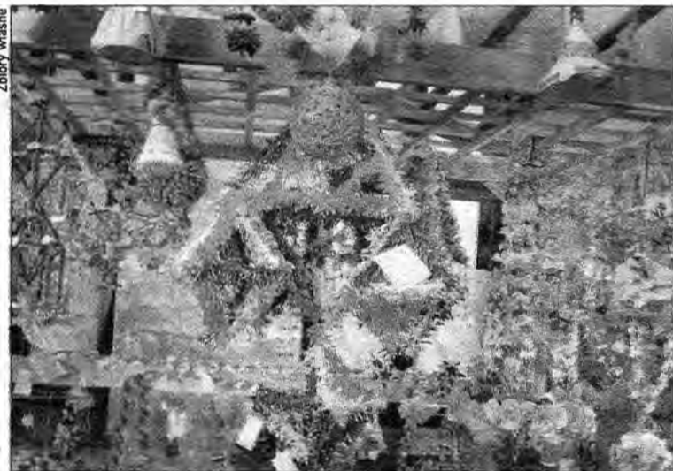
Uczniowie wykonywali bożonarodzeniowe pająki.