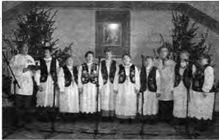
Zespół Śpiewaczy z Wiązownicy – laureat pierwszego miejsca.

Zdecydowanie pastorałki i zapomniane koledy królowały podczas przeglądu w kościele parafialnym w Pawłosiu. Ale można było też usłyszeć niecodzienne koledy patriotyczne czy gospodarskie.