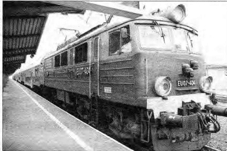
Jeżeli do 1 kwietnia br. nie wyjaśni się, kto będzie dalej woził pasażerów, a samorząd nie przyjmie warunków Przewozów Regionalnych, pociągi na Podkarpaciu mogą stanąć.

Jeszcze w październiku 2009 r. samorząd ogłosił przetarg na wykonywanie połączeń kolejowych na Podkarpaciu w latach 2010 – 2012. W budżecie województwa na ten cel zabezpieczono kwotę 105 mln zł. Wpłynęła tylko jedna oferta. Od spółki Przewozy Regionalne. Kolejarze za trzyletnią obsługę połączeń na kilku trasach (m.in.: Tarnów – Przemyśl, Przeworsk – Stalowa Wola Rozwadów, Jarosław – Horyniec-Zdrój) zażądali ponad 135 mln zł! To postawiło samorząd pod ścianą, zmusiło do unieważnienia przetargu i ogłoszenia nowego. W połowie grudnia ub.r. zaczęły się negocjacje z Przewozami Regionalnymi w sprawie zapewnienia połączeń choć na pierwsze trzy miesiące br. Samorząd zadeklarował, że zapłaci kolei za ten okres 8,75 mln zł. Ale Przewozy Regionalne znów zażądają o blisko 1,5 mln zł więcej. Samorząd ponownie nie zgodził się na takie dictum, ale z przewoźnikiem nie chciał się rozstać. Gdyby do tego doszło, tysiące pasażerów musiałyby się przesiąść do autobusów, a pociągi by stanęły.