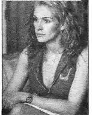
Erin Brockovich – dramat obyczajowy, USA 2000, reż. Steven Soderbergh. Erin Brockovich ulega wypadkowi. Przegrywa w sądzie sprawę o odszkodowanie, ale wymusza na adwokacie, by ją zatrudnił w swej kancelarii. Kobieta trafia na trop afery w miasteczku Hinkley.