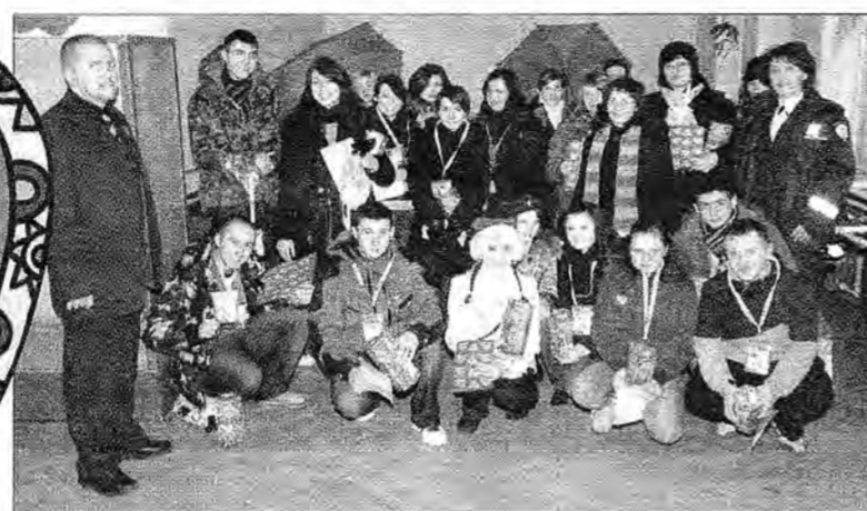
Grupa wolontariuszy z Państwowej Wyższej Szkoły Wschodnioeuropejskiej przed wyruszeniem na ulice.