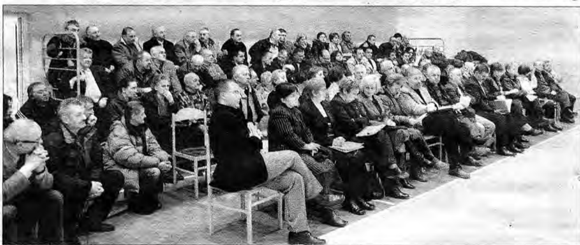
Ubiegłoroczne debaty z mieszkańcami wsi były gorące (na zdjęciu mieszkańcy Prałkowic). Czy równie wysoka temperatura dyskusji będzie i tym razem?

Mieszkańcy sołectw, o które chce się poszerzyć miasto Przemyśl, mogą wyrazić swoją opinię w tej kwestii w czasie spotkań z prezydentem i członkami zespołu ds. poszerzenia.