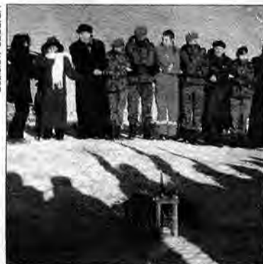
Przekazanie Betlejemskiego Świąteczka Pokoju w Malhowicach.

Jeszcze przed Bożym Narodzeniem w obrządku wschodnim, w miejscu planowanego przejścia granicznego Malhowice – Niżankowice polscy harcerze przekazali ukraińskiemu kolegom Betlejemskie Świąteczko Pokoju.