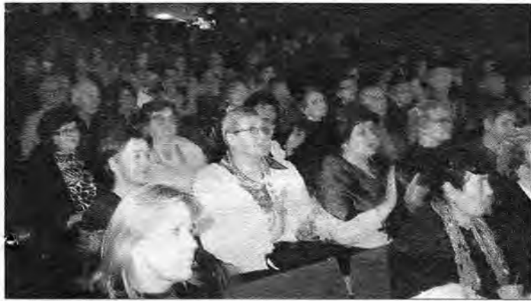
W 20 sekcjach i kołach Akademii Trzeciego Wieku działa 270 słuchaczy.

Mają już wpis do Krajowego Rejestru Sądowego i 270 złożonych deklaracji od osób chcących nadal, mimo pewnych niedogodności, uczestniczyć w zajęciach. Akademia Trzeciego Wieku zainaugurowała nowy rok.