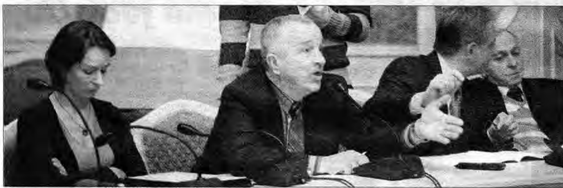
A radni PiS i Samorządny Przemyśl od razu podnieśli larum: – Głosował we własnej sprawie?! Uchwała będzie nieważna!