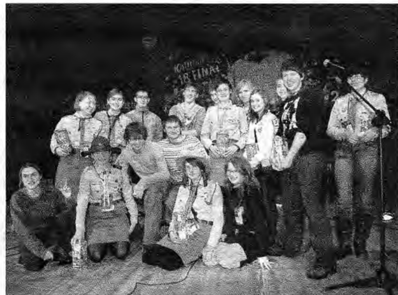
Grupa wolontariuszy z Przeworska.

wają. Jestem pewien, że po przeleceniu walut obcych i wycenie precjozów przekroczymy osiemdziesiąt tysięcy i tym samym pobijemy ubiegłoroczny wynik, który wynosił siedemdziesiąt pięć tysięcy złotych. Było to możliwe dzięki ogromnemu zaangażowaniu wolontariuszy, celników, policjantów, strażników miejskich, restauratorów, pracowników Centrum Kulturowego i wielu innych ludzi otwartego serca.