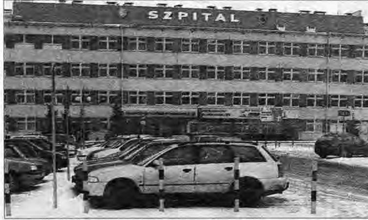
Czy szpital wojewódzki połączy się ze 114. Szpitalem Wojskowym? Załoga tego drugiego jest temu przeciwna.

Jak dowiedzieliśmy się od dyrektora Departamentu Prasowo-Informacyjnego MON płk. Wiesława Grzegorzewskiego, ministerstwo zdecydowało się pozbyć przemyskiego szpitala wojskowego ze względów... praktycznych. – Fakt znakomitej kondycji finansowej szpitala nie ma tu nic do rzeczy. Musimy po prostu dostroić ilość szpitali do liczby wojska. Nasza armia zostanie zmniejszona do 120 tysięcy żołnierzy, a przecież szpitale wojskowe tak naprawdę nie służą wojsku. Naszym głównym zamierzeniem