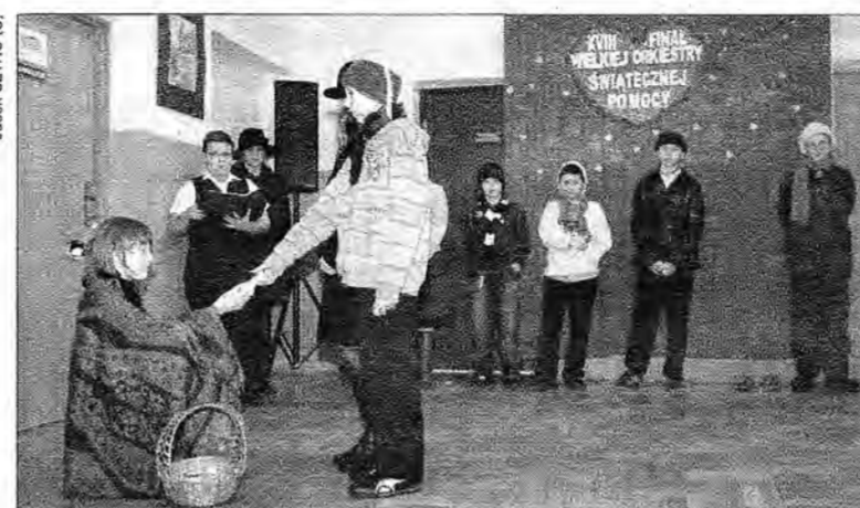
W Szkole Podstawowej w Hermanowicach z okazji XVIII finału WOŚP zorganizowano kilkugodzinny blok imprez, podczas którego zebrano 2 tysiące 150 złotych. Na zdjęciu młodzież podczas inscenizacji Dziewczynki z zapalkami.