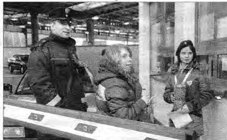
Wolontariusze kwestowali na przejściu granicznym w Medyce.