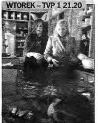
Wielka powódź – film katastroficzny, Niemcy 2005, reż. Jorgo Papavassiliou. Wybrzeże RFN w pobliżu Hamburga, luty 1962 r. Na Morzu Północnym wieją potężne wiatry, które powodują powstanie ogromnych fal. Woda wdziera się na ląd i zalewa miasto.

Materiał informacyjny, internetowy oraz zdjęcia zostały dostarczone przez A plus C. Oprac. MŻ.