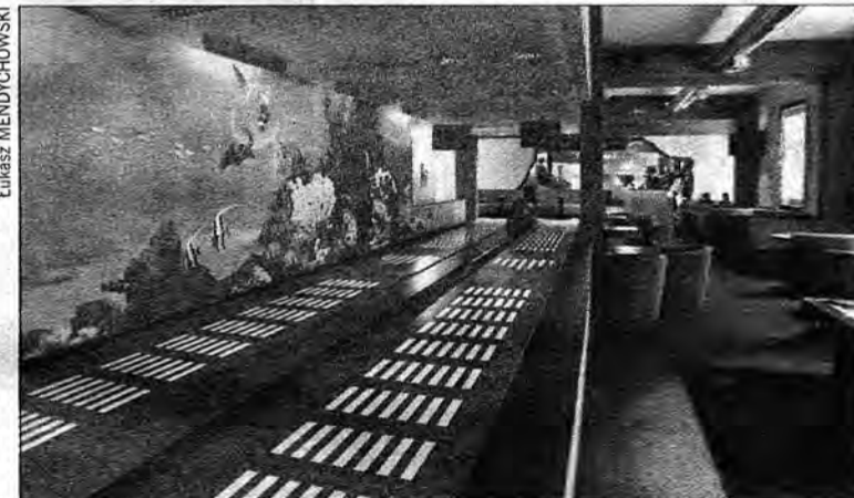
Nowością w NEO są dwa tory do kregli.

Sam pomysł na stworzenie lokalu, w którym oprócz konsumpcji czy typowej dyskoteki będą jeszcze inne atrakcje, takie jak bilard czy kregle, już od dawna kiełkował w głowie właścicieli. – W Przemyślu mamy już typowe pizzerie, restauracje, dyskoteki, miejsca, w których można zagrać w bilard czy