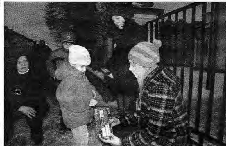
Akcję wspierali zarówno duzi, jak i mali. Tu zbiórka przed kościołem w Oleszycach.

podpisem premiera Donalda Tuska. W powiecie jarosławskim w finału Orkiestry włączyło się prawie tysiąc osób. Na ulicach miasta, a także w: Dobkowicach, Muninie, Pawłosiowie, Pełkiniach, Pruchniku, Radymnie, Szówsku, Tucempach, Wiazownicy, Kidalowicach, Ożansku, Wierzbnej, Mołodyczu, Radawie i Rokietnicy kwestowali młodzi ludzie ze 150 puszkami. Jak co roku uczniowie jarosławskich szkół organizowali własne imprezy, z których dochód przekazali Orkiestrze. Taka szkolna impreza odbyła się w Zespole Szkół Technicznych i Ogólnokształcących w Jarosławiu. Zmobilizowali się także sportow-