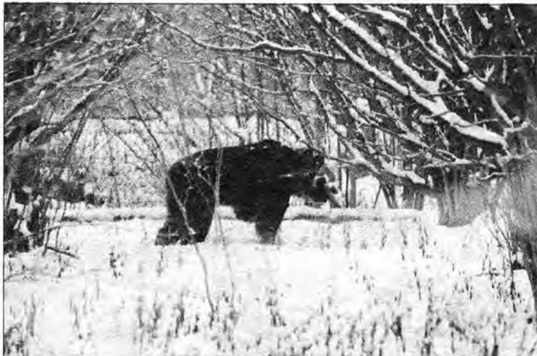
Niedźwiedzica przekroczy granice miasta.

Miś spokojnie przycupnął w jakimś zacisznym miejscu. To kres jego