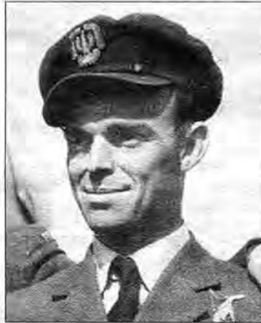
Lotnik legenda – generał TADEUSZ GÓRA

ciężył w V Krajowych Zawodach Szybowcowych. Na stałe zapisał się na kartach historii światowego lotnictwa 18 maja 1938 r., gdy w wieku zaledwie 20 lat za przekroczenie bariery 500 km w swobodnym locie szybowcowym przyznano mu Medal Lilienthala – jedno z najcenniejszych szybowcowych trofeów. Jego kariera sportowa została przerwana wyrokiem dziejów i zamiast przygotowywać się na Igrzyska Olimpijskie w Helsinkach w 1940 r. musiał przedzierać się za Skandynawii, gdzie zastała go wojna, przez Litwę, Łotwę i Szwecję do Armii Polskiej gen. Sikorskiego we Francji. Następnie ewakuował się do Wielkiej Brytanii, gdzie został wcielony do 316. polskiego dywizjonu myśliwskiego. Wykonał w sumie 883 loty bojowe. Za osiągnięcia bojowe odznaczony został Krzyżem Srebrnym Orderu Wojennego Virtuti Militari, trzykrotnie Krzyżem Walecznych oraz brytyjskimi The 1939-1945 Star, The War Medal 1939-1945 i The Defence Medal. Po wojnie wrócił do kraju