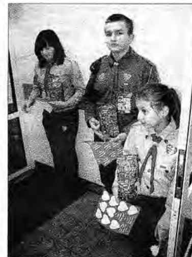
W Zarzeczcu kwestowało 21 wolontariuszy. Dzięki hojności mieszkańców miejscowości i całej gminy zdołano na ten szczytny cel zgromadzić 5 tysięcy 209 zł i 71 zł

W Przeworsku, w wyniku całodziennego kwestu na rzecz Wielkiej Orkiestry Świątecznej Pomocy udało się zebrać 14 tysięcy 662 złote i 60 gr. Akcją objęta była się w dwóch odsłonach. Najpierw samorząd osiedla nr 6 Grupa Anonimo-