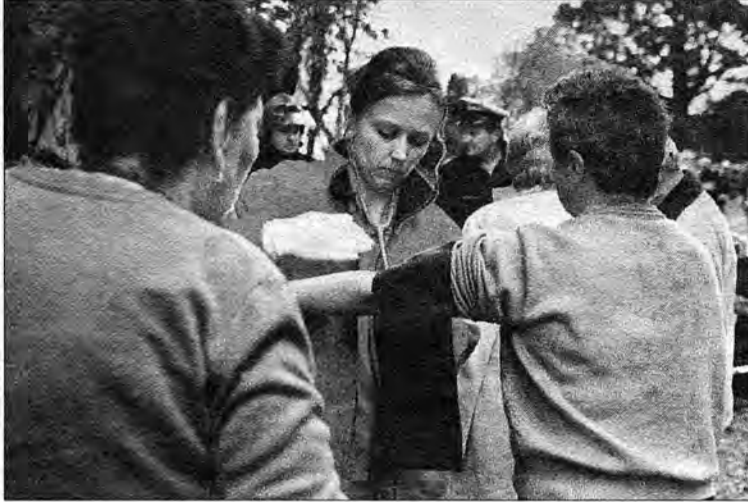
W wypadku na Dybawce ucierpiało kilkadziesiąt osób.

Jak ustalili prokuratorzy, kierowca autokaru jechał zbyt szybko, około 70 km na godzinę. Zbyt późno zaczął też redukować biegi, co doprowadziło ostatecznie do przewrócenia autokaru. Ponadto, jak stwierdzili biegli, układ hamulcowy w pojeździe działał niewłaściwie. 44-letni mężczyzna przyznał się do winy. Sławomir O. wniósł o skazanie bez przeprowadzania rozprawy, uzgadniając z prokuratorem karę 1,5 roku więzienia w zawieszaniu na 3 lata oraz 1200 złotych grzywny.