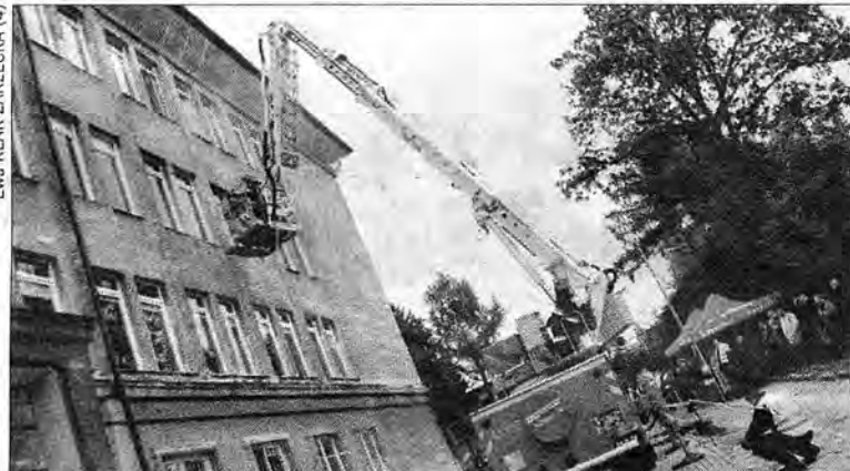
Ćwiczenia obrony cywilnej rozpoczęły się pożarem w Szkole Podstawowej nr 4.

Trzeci epizod rozegrał się już na obrzeżach miasta. Tu doszło do wypadku autobusu przewożącego młodzież. Część pasażerów wy-