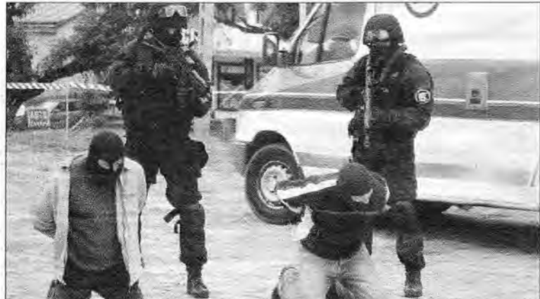
Funkcjonariusze oddziału antyterrorystycznego obezwładnili napastników.

Ćwiczenia obrony cywilnej zostały przeprowadzone w ramach