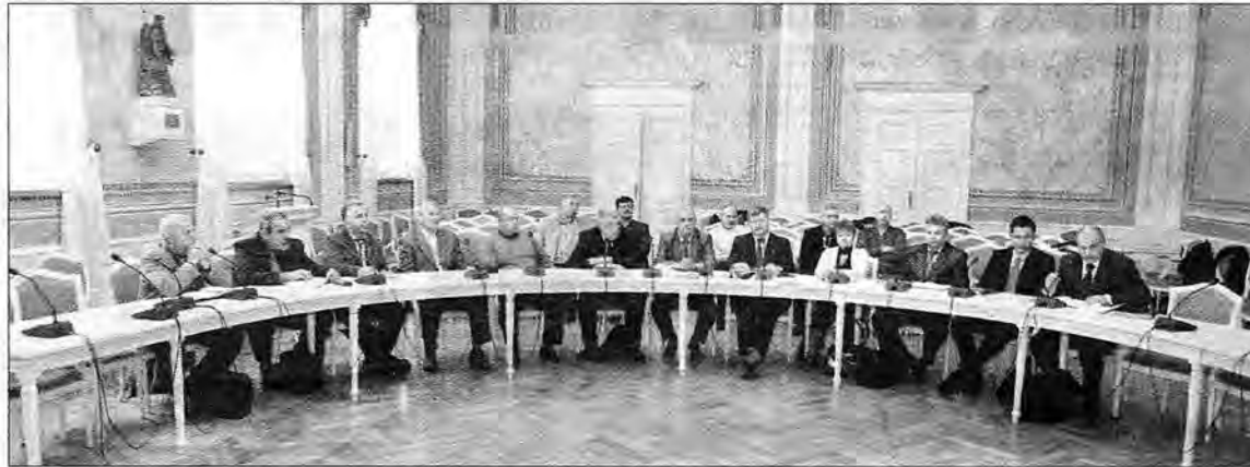
Podczas spotkania w przemyskim magistracie zawiązał się Społeczny Komitet Obrony Kolei na Podkarpaciu.

Mówi się – na razie nieoficjalnie – że restrukturyzacja polegać będzie na połączeniu zakładów w Krakowie, Nowym Sączu i Przemyśle. Siedzibą nowego zakładu będzie Nowy Sącz. – Ta decyzja jest dla nas nie do przyjęcia. To decyzja polityczna, z ekonomią niemająca nic wspólnego. Choć nikt tego nie mówi na razie głośno, na pewno będą zwolnienia. Podczas pierwszej restrukturyzacji odeszło z pracy w przemyskim zakładzie pół tysiąca osób. Obec-