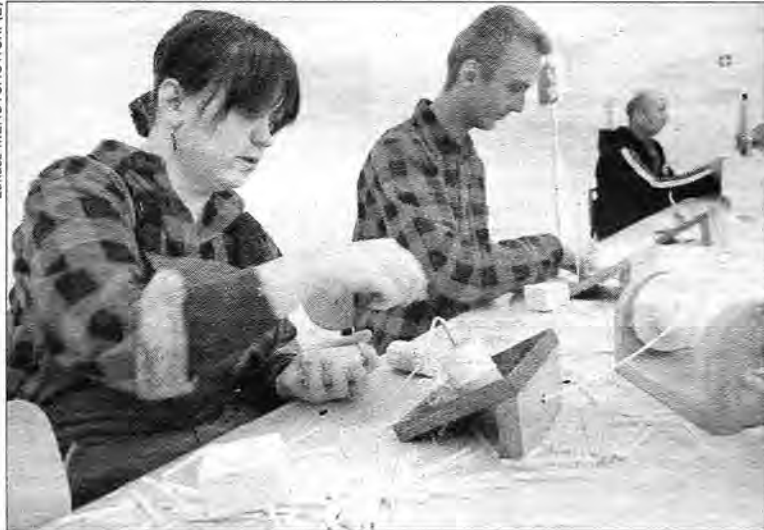
Dziennie pracownicy ZAZ w Starych Oleszycach są w stanie wyprodukować 150 ekologicznych podpałek.

Osoby zatrudnione w oleszyckim ZAZ zajmują się działalnością produkcyjno-usługową. Produkują ekologiczne podpałki do komin-