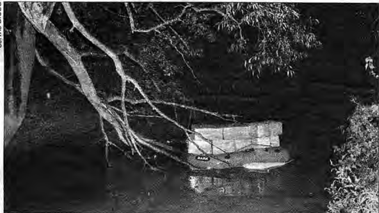
Papierosy zarekwirowane przez pograniczników na rzece Szkło.

Misterny plan kontrabandy przygotowany przez dwóch braci, mieszkańców powiatu jarosławskiego legł w gruzach. Wszystko przez dobrą współpracę służb granicznych Polski i Ukrainy. To właśnie strona ukraińska poinformowała funkcjonariuszy Bieszczadzkiego Oddziału Straży Granicznej w Przemyśle o nielegalnej „podróży” papierosów przez granicę rzeką Szkło. Do akcji przystąpili funkcjonariusze z placówki w Korczowej. Właśnie na Szkle zatrzymali dwóch Polaków, mieszkańców powiatu jarosławskiego, którzy, będąc w zмовie z ukraińskimi „dostawcami”, próbowali przemyścić do Polski 100 tys. sztuk, czyli 5 tys. paczek papierosów. Rynkowa wartość tej kontrabandy to 40 tys. zł.