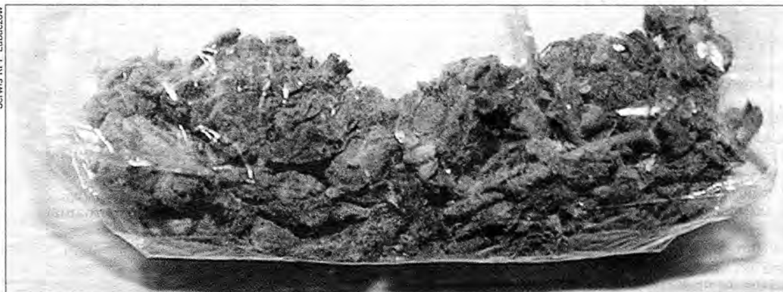
Marihuana zarekwirowana podczas poniedziałkowej akcji.

W poniedziałek, 27 września, policjanci zatrzymali kierującą samochodem osobowym 22-letnią mieszkankę powiatu lubaczowskiego. Kobieta miała przy sobie tzw. skręta z marihuany. Podczas wyjaśnień przyznała się również, że zanim wsiadła za kierownicę, paliła marihuanę. Nie było to przypadkowe zatrzymanie. Funkcjonariusze od dłuższego czasu rozpracowywali środowisko osób, w stosunku do których były podejrzenia o używanie środków odurzających. Prawie w tym samym czasie funkcjonariusze odwiedzili pewnego 25-letniego mieszkańca Lubaczowa i w jego mieszkaniu