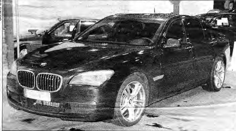
Jeden z zatrzymanych samochodów.

Kolejny raz okazało się, jak bardzo pomocna w uszczelnianiu zewnętrznej granicy Unii jest elektroniczna baza danych, którą posługują się służby graniczne. Tylko w ciągu dwóch dni funkcjonariusze Straży Granicznej na przejściach granicznych w Medyce i Krościenku po sprawdzeniu w systemie zakwestionowali i udaremniili wywóz za granicę czterech aut. Dwaj obywatele Niemiec próbowali wyjechać na Ukrainę, jeden samochodem marki BMW 730d wartym 430 tysięcy zł, a drugi Renault Traffic. Wpadli też dwaj kurierzy ukraińscy jadący samochodami marek: BMW X5 (warto-