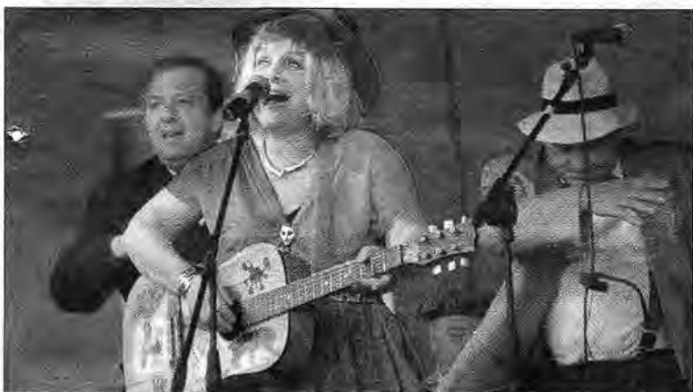
Lwowski kabaret „Pacalycha” na jarosławskiej scenie.