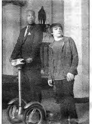
Superhero - komedia, USA 2008. Fajtkapowaty nastolatek zostaje ugrzyziony przez zmodyfikowanego genetycznie owada. Wkrótce chłopak odkrywa, że ma nadnaturalne zdolności.

Materiał informacyjny, internetowy oraz zdjęcia zostały dostarczone przez A plus C. Oprac. M2