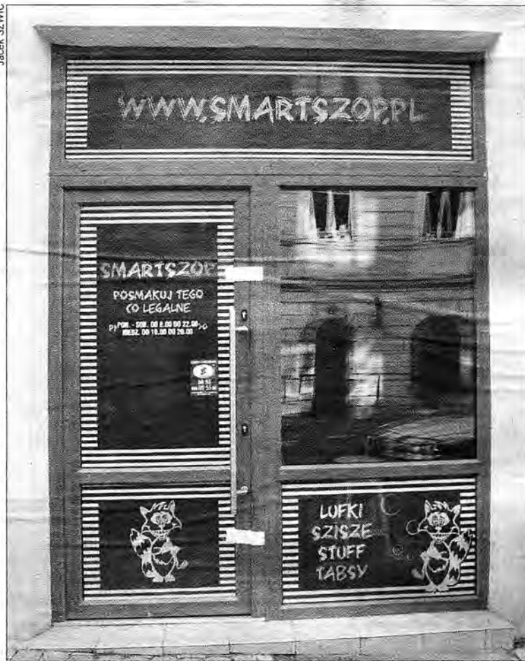
Smart Shop przy ulicy Mniszej.