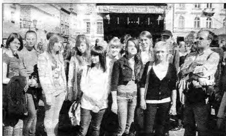
Gimnazjaliści z Przemyśla uczestniczyli w imprezie zorganizowanej w Krakowie z okazji VII Europejskiego Dnia Języków Obcych.

Doskonałą okazją do sprawdzenia swoich umiejętności językowych w konfrontacji z rówieśnikami z innych szkół Polski był dla grupy uczniów przemyskiego Gimnazjum nr 2 udział w krakowskich obchodach VII Europejskiego Dnia Języków Obcych. Odbyły się one na dwa dni przed tym europejskim świętem, którego celem jest pokazanie korzyści płynących z nauki języków obcych.