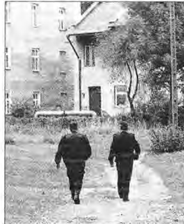
Funkcjonariusze SM patrolują teren wspólnoty mieszkaniowej Popielów.

się na Kazanów. Pogoda raczej nie zachęca do przebywania pod chmurką i pewnie dlatego osiedle wygląda jak wyludnione. Dyżurny z bazy przez radio kieruje patrole w okolice ulicy Sikorskiego, gdzie ponoć obok sklepu z piwem gromadzi się jakaś grupka mężczyzn. Patrole piesze i zmotoryzowane przez radiotelefony ustalają stra-