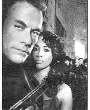
Korpus weteranów - thriller, USA 2006. Philippe Sauvage, były żołnierz sił specjalnych, zostaje wynajęty do ochrony majątku przedsiębiorcy, Wayne'a Barclaya. Formuje więc oddział złożony z byłych żołnierzy, tworząc korpus weteranów.