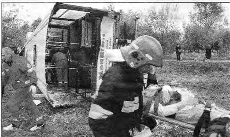
Służby ratownicze mogły się wykazać, udzielając pomocy młodzieży „rannej” w wypadku autobusu.

akcji „Bezpieczny Jarosław 2010” i miały na celu sprawdzenie stanu gotowości służb odpowiedzialnych za prowadzenie działań w sytuacji zagrożenia kryzysowe-