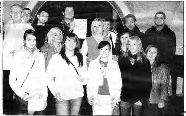
Wolontariusze odebrali podziękowania za udział w akcji „Stop powodziom”.

Towarzystwo Ulepszania Miasta i kawiarnia „Libera”