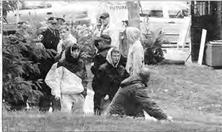
Interwencja na ul. Sikorskiego.