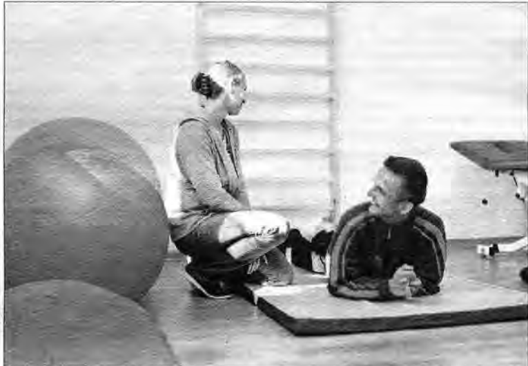
Do dyspozycji pracowników ZAZ w Starych Oleszycach jest także psycholog i fizjoterapeuta.

– Produkowanie podpałek ekologicznych w Starych Oleszycach to