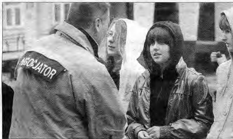
Negocjator, który wcześniej negocjował z terrorystami, po akcji uspokajał młodzież.

szła z autokaru o własnych siłach, część została przygnieciona siedzeniami lub utknęła między poręczami. Widok wnętrza autobusu był naprawdę makabryczny. Grozy