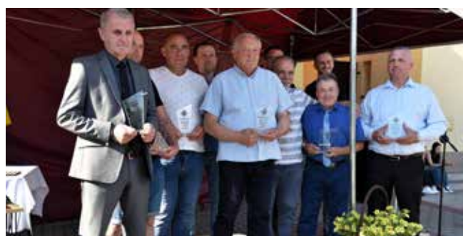
Izolator Boguchwała, Jedność Niechobrz, Iskra Zgłobień, LOK Razem